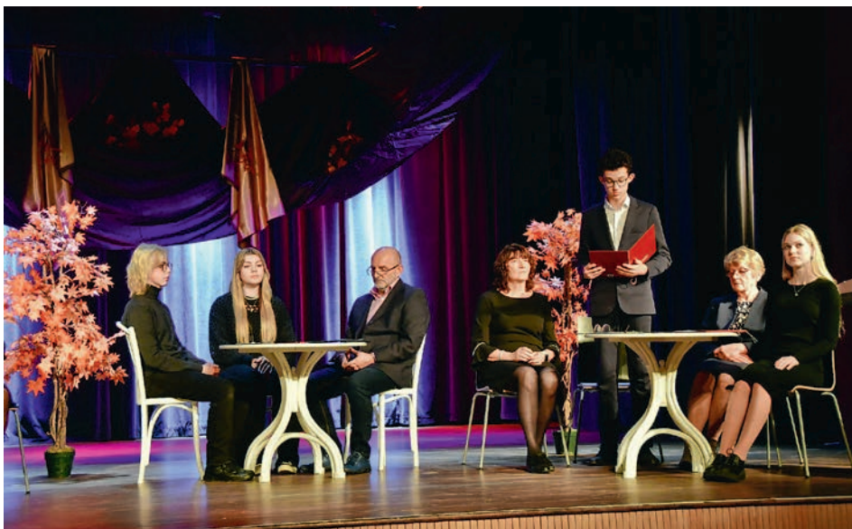
Na scenie wystąpiły teatry UNO i Teatr Małych Form